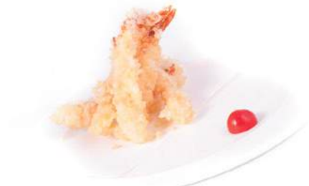
181. EBI TEMPURA Tempura di gamberi