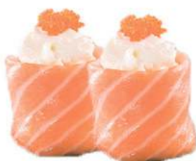
53.GUNKAN PHILADELPHIA riso, philadelphia, salmone, kataifi