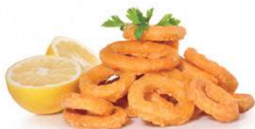
183. IKA FURAI Tempura di calamari