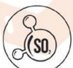
Diossido di zolfo