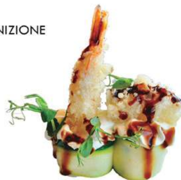
235.GUNKAN EBITEN 🐙 riso avvolto da zuccina, gambero in tempura, philadelphia, salsa teriyaki