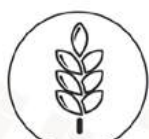
Cereali che contengono glutine