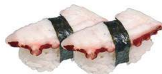
34.TAKO 🐙 Polpo