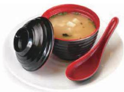
17. ZUPPA DI MISO 🌱 Zuppa di soia con alghe e tofu