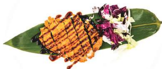
184. CHICKEN FURAI Tempura di pollo