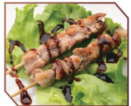
194. SPIEDINI DI POLLO