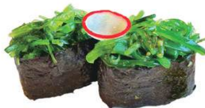
255.GUNKAN WAKAME 🌿 riso, alga nori, alga wakame