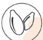
Semi di sesamo