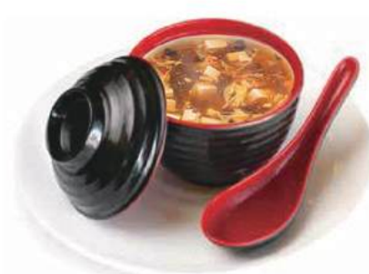
18. ZUPPA AGROPICCANTE 🌱 🌶️ zuppa con verdure, tofu, uova