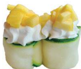
236.GUNKAN FRESH 🌿 riso avvolto da zuccina, philadelphia, mango