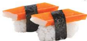
35.KANI 🐙 Polpa di granchio