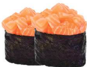
50.SPICY SALMON 🌶️ riso, tartare di salmone piccante, salmone

BASE DI RISO AVVOLTA IN FILETTI DI PESCE O ALGA NORI, CON GUARNIZIONE