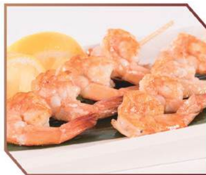
193. SPIEDINI DI GAMBERI