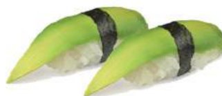
37.AVOCADO 🌿 Avocado