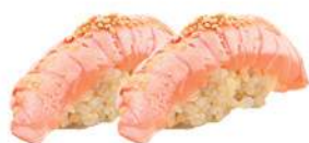
38.SAKE FLAMBÉ 🐟 Salmone flambé, salsa teriyaki