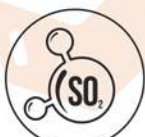
Diossido di zolfo