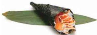
71.SPICY SALMON TEMAKI 🌶️ Salmone, insalata, salsa piccante