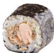
86.TONNO COTTO MAKI 🐟 Tonno sott'olio