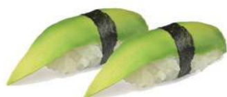
37.AVOCADO 🌿 Avocado