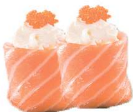
53.GUNKAN PHILADELPHIA riso, philadelphia, salmone, kataifi