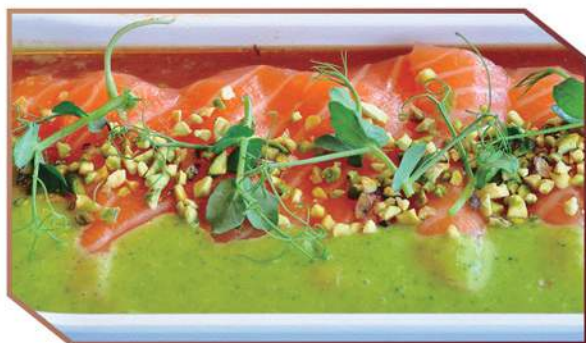
M247.CARPACCIO SWEET SALMON +2€ Carpaccio salmone, salsa mela, salsa ponzu, granella di pistacchio