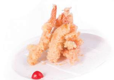
182. TEMPURA MISTA Tempura di gamberi e verdure