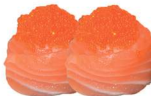
52.GUNKAN TOBIKO riso, uova di pesce volante, salmone