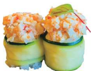
254.GUNKAN EBI 🐟 riso avvolto da zuccina, tartare di gambero cotto e granchio, tobiko, maionese