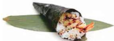
76.EBITEN TEMAKI 🐟 Gambero fritto, insalata, salsa teriyaki