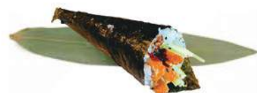
260.TORY FRY TEMAKI 🐟 pollo fritto, cetrioli, salsa teriyaki