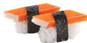
35.KANI 🐟 Polpa di granchio