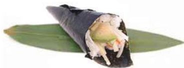
74.CALIFORNIA TEMAKI 🐟 Polpa di granchio, avocado, maionese