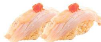
39.BRANZINO FLAMBÉ 🐟 Branzino flambé, salsa teriyaki