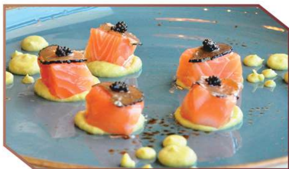
M245.CUBE SALMON +2€ cubetti di salmone, base salsa avocado, tartufo