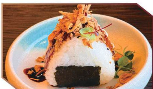
100.SAKE GIRI Salmone, avocado