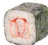
85.KANI MAKI 🐟 Polpa di granchio