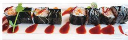
261.POLLO MAKI 🐟 pollo fritto, philadelphia, teriyaki