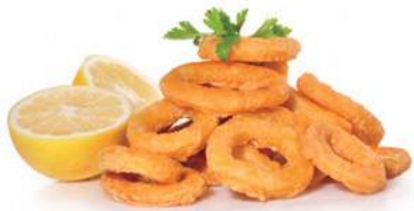
183. IKA FURAI Tempura di calamari