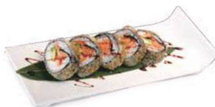
92.FUTO FRITTO 🐟 Futomaki fritti con ripieno di salmone avocado, philadelphia, salsa teriyaki