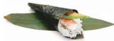
75. EBI TEMAKI 🐟 Gambero cotto, avocado, maionese