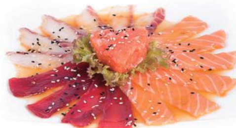
147.CARPACCIO MISTO Salmone, branzino, tonno