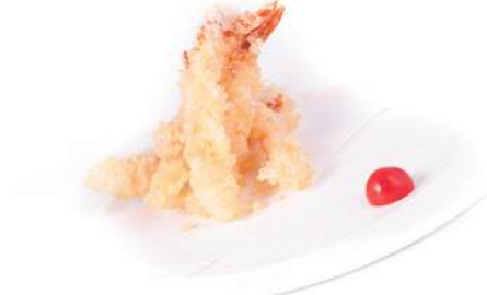
181. EBI TEMPURA Tempura di gamberi