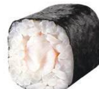
82.EBI MAKI 🐟 Gambero cotto