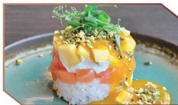
243.WHITE CAKE tortino di riso bianco, tartare al salmone, mango, philadelphia, granella di pistacchio, salsa al mango