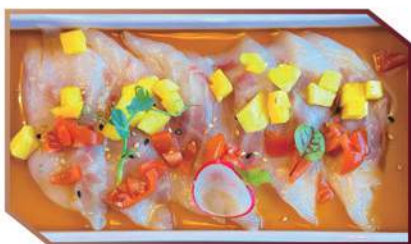
266.CARPACCIO SUZUKI MIX branzino, pomodorini, mango