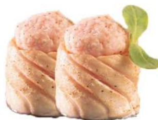
54.GUNKAN FLAMBÈ 🐟 riso, salmone flambé, philadelphia, mandorle