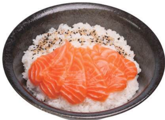
60.CIRASHI SALMONE Salmone

CIOTOLA DI RISO CON FILETTI DI PESCE CRUDO