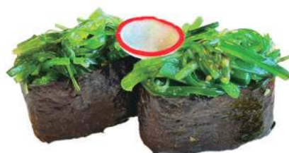
255.GUNKAN WAKAME 🌿 riso, alga nori, alga wakame