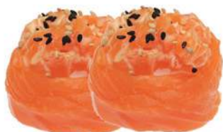
50.SPICY SALMON 🌶️ riso, tartare di salmone piccante, salmone

BASE DI RISO AVVOLTA IN FILETTI DI PESCE O ALGA NORI, CON GUARNIZIONE