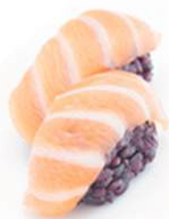
40.BLACK SAKE Salmone, riso nero