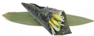
77.VEGETARIANO TEMAKI 🌿 Avocado, cetrioli, insalata