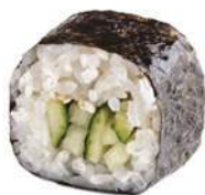
83.AVOCADO MAKI 🌿 Avocado