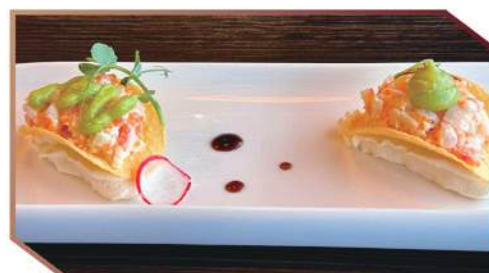
257.CRISPY EBI 🐟 base croccante di patatina, tartare di gambero cotto e granchio,philadelphia, tobiko, salsa avocado