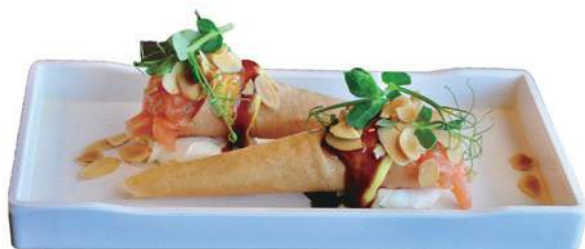
237.CONO SALMON sfoglia di cono, tartare di salmone, philadelphia, salsa flambé, salsa teriyaki, mandorle tostate