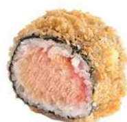
87.MAKI FRITTO 🐟 hosomaki fritti ripieni di salmone, kataifi, salsa teriyaki