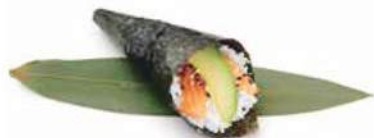
70.SAKE TEMAKI Salmone, avocado