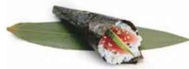
72.MAGURO TEMAKI Tonno, avocado