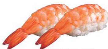
33.EBI 🐟 Gambero cotto