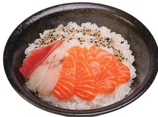
61.CIRASHI MISTO Salmone, branzino, tonno