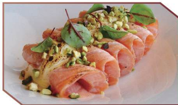
M246.CARPACCIO FLAMBE +2€ Carpaccio salmone flambé, salsa miso scottato, granella pistacchio