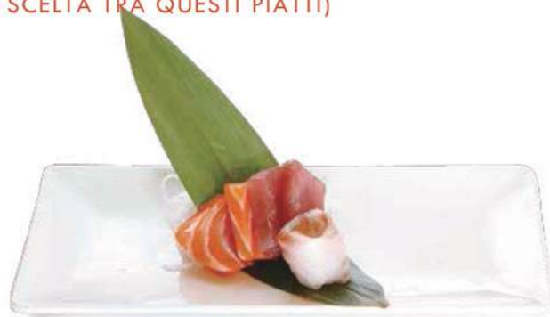
143. SASHIMI MISTO Salmone, branzino, tonno