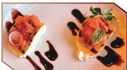
256.CRISPY SALMON base croccante di patatina, tartare di salmone, philadelphia, tobiko, salsa teriyaki

MAX 1 PORZIONE A SCELTA TRA QUESTI PIATTI