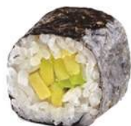
84.KAPPA MAKI 🌿 Cetrioli