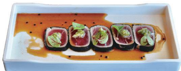
M248.TATAKI SPECIALE +2€ tonno scottato avvolto da alga nori, wasabi fresco, salsa ponzu