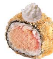
88.MAKI PHILA FRITTO 🐟 hosomaki fritti ripieni di salmone, philadelphia,kataifi, salsa teriyaki