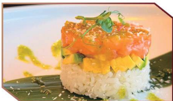
258.GREEN CAKE tortino di riso bianco, tartare al salmone, avocado, scaglie di cocco, salsa alla mela