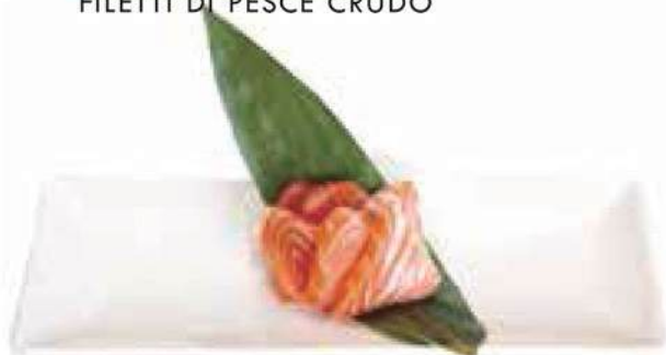
140. SASHIMI SALMONE