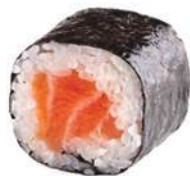
80.SAKE MAKI Salmone

ROTOLINI DI RISO CON RIPIENO AVVOLTI IN ALGA NORI