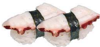
34.TAKO 🐟 Polpo