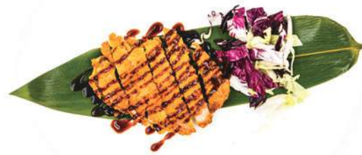
184. CHICKEN FURAI Tempura di pollo