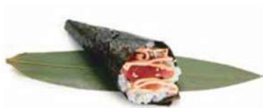
73.SPICY TUNA TEMAKI 🌶️ Tonno, insalata, salsa piccante