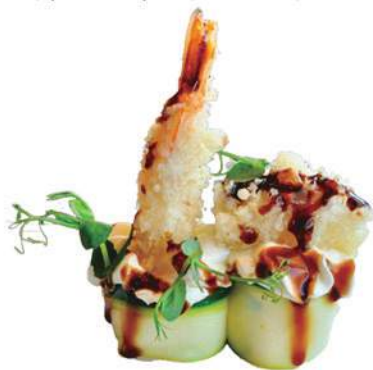
235.GUNKAN EBITEN riso avvolto da zuccina, gambero in tempura, philadelphia, salsa teriyaki