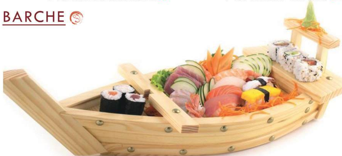
151. BARCA MEDIA 34PZ minimo 2 persone