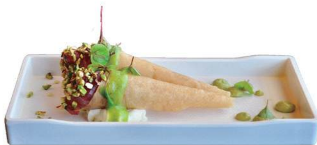
238.CONO TUNA sfoglia di cono, tartare di tonno, philadelphia, salsa mela, granella di pistacchio