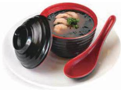
16. ZUPPA DI MARE Zuppa con frutti di mare