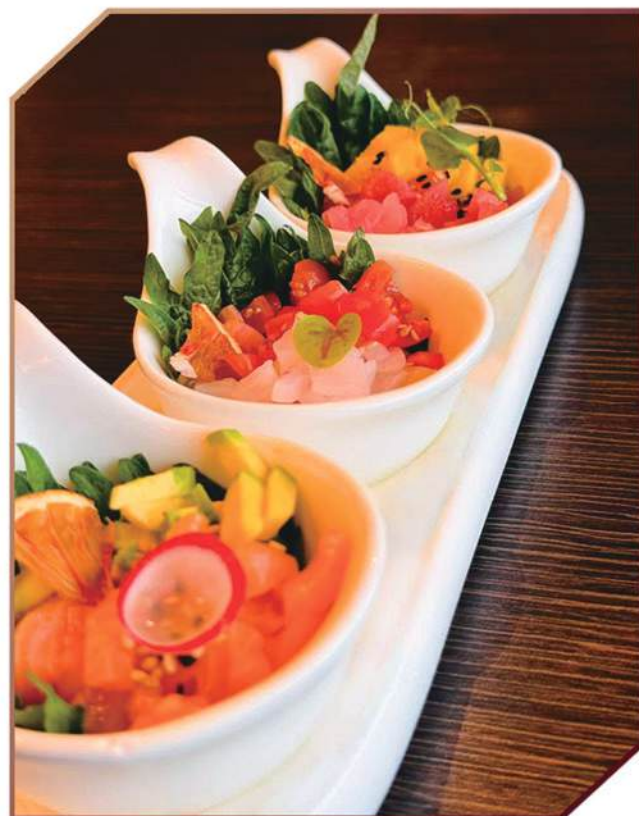
M265.TRIS DI TARTARE +2€ salmone e avocado, branzino e pomodorini, tonno e mango, sesamo