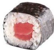
81.MAGURO MAKI Tonno