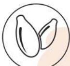
Semi di sesamo