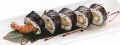
91.FUTO EBITEN 🐟 Gamberi in tempura, avocado philadelphia, salsa teriyaki