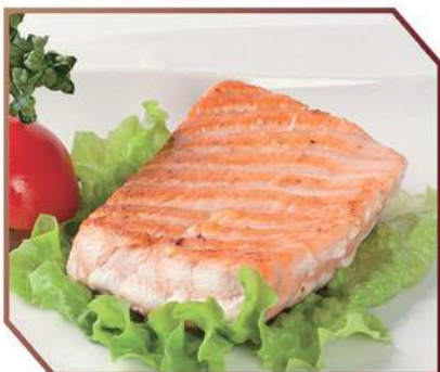
194. SPIEDINI DI POLLO