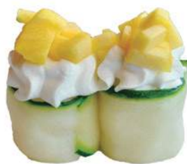
236.GUNKAN FRESH 🌿 riso avvolto da zuccina, philadelphia, mango